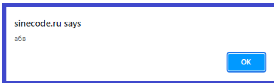
Рис. 1. Консоль ввода-вывода данных

Платформа имеет функцию ввода-вывода, что позволяет построение различных языковых сценариев.